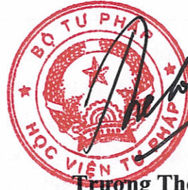
Trương Thế Côn